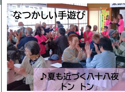
なつかしい手遊び