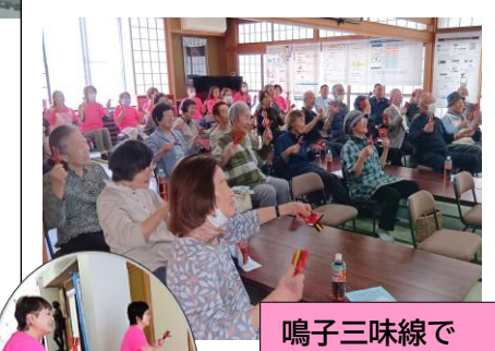
鳴子三味線で ♪「帰って来いよ」