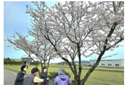
帰りにちよっとお花見🌸