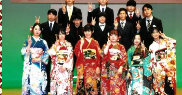
祝 南砺市福野地域成人式

(令和4年11月末現在) 前月比 人口 1,771名 (-9) (男) 868名 (-4) (女) 903名 (-5) 世帯数 556世帯 (-2)