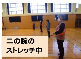
二の腕のストレッチ中