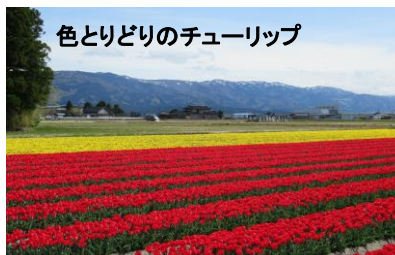
色とりどりのチューリップ

東部わいわい広場&トープル美術館 2021《東部地区オリエンテーリング〜とうぶ大発見!!》で回答がありました『東部地区の好きなところ、おもしろい人や場所など、東部地区のおすすめは?』をご紹介します。