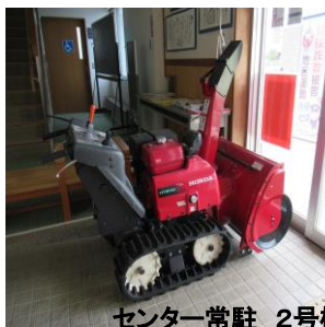
センター常駐 2号機