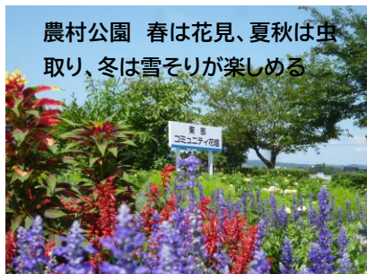
農村公園 春は花見、夏秋は虫取り、冬は雪そりが楽しめる