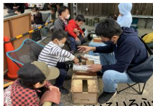
イベントいろいろふくの里