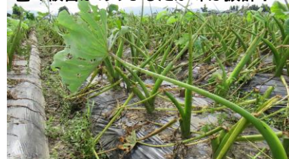
雹の被害がありましたでしたが味は抜群!

東部地区のイベント(いもほり、もちつき大会、田んぼにおえかき、キッズホーム、あんどんなど)もおすすめにあげています。ここ、2年、イベントごとはコロナウイルス感染拡大防止や天候の影響で縮小や中止になりましたが、子どもたちは自然豊かでいろいろなイベントある東部が“いい👍”と感じているようです。たのしいですね。